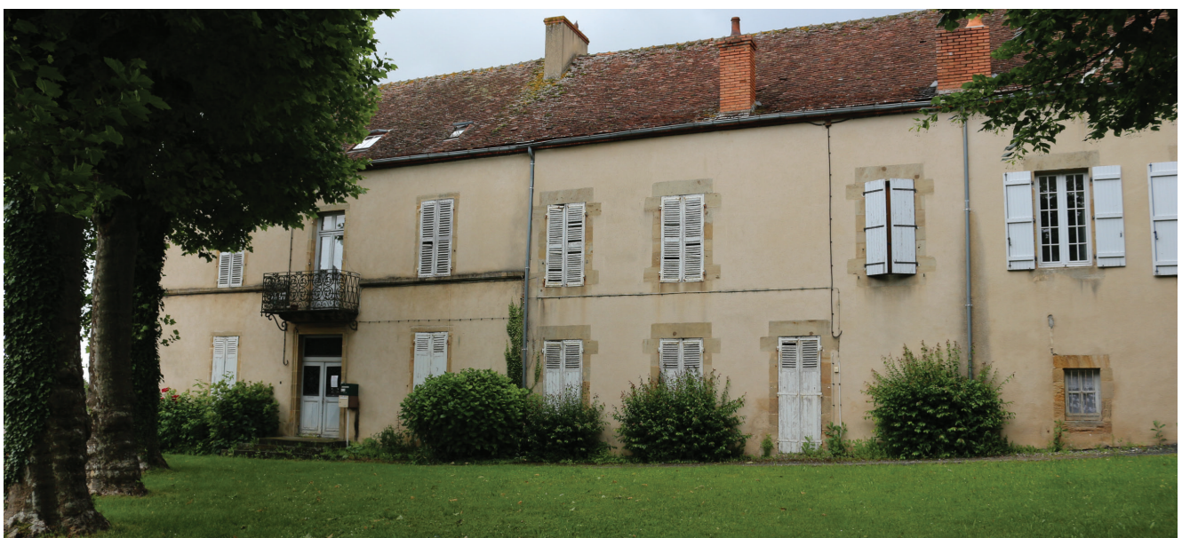
«Le prieuré» où Talleyrand logeait à Bourbon l'Archambault est aujourd'hui une structure d'accueil de la petite enfance. La relative modestie des lieux étonne