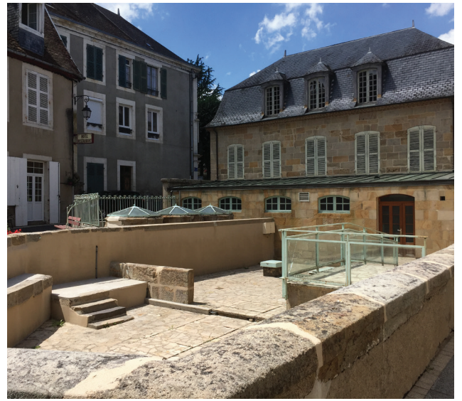
Le même endroit, actuellement, vu sous un angle un peu différent